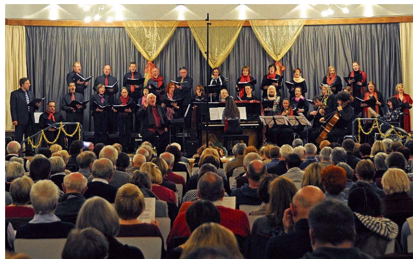
Der Yellow-Submarine-Chor sammelte bei einem gut besuchten Benefizkonzert am Sonntag Spenden für die SZ-Aktion „Hilf-Mit!“.

Die vom Bildungsministerium und der Landeszentrale für politische Bildung mitgeförderte Produktion sollte man auf Tournee durch alle Saar-Schulen schicken. Völlig unverständlich, warum bisher nur zwei weitere Aufführungen, im März im Theater Überzweig, geplant sind.