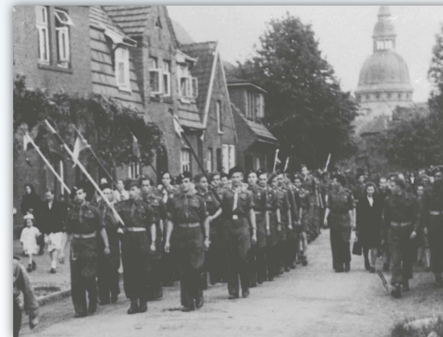
Marsch polnischer Pfadfinder durch die polnische Enklave Maczków/Haren (Ems) Foto, ca. 1945 – 1948

Seminar in Zusammenarbeit mit der Interessengemeinschaft niedersächsischer Gedenkstätten und Initiativen zur Erinnerung an die NS-Verbrechen